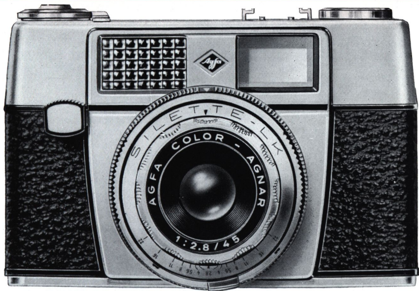
Agfa Silette LK DM 169,—

Wie wird mit der Silette LK photographiert? Die Belichtungszeit wird vorgewählt. Für ein ruhiges Motiv zum Beispiel die 1/60, für einen Schnapsschuß die 1/125 Sek. oder für eine rasante Sportaufnahme die 1/250 Sek. Danach brauchen Sie nur noch den Zeiger des Belichtungsmessers auf die Nullmarke einzustellen — die richtige Belichtung ist gesichert.